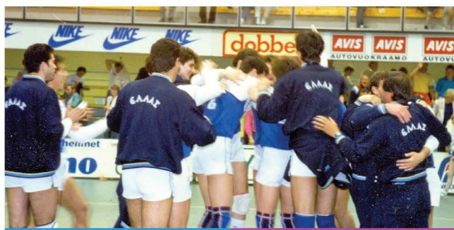
Μάιος 1987, Πόρι.

10/05/87 ΕΛΛΑΔΑ - ΡΟΥΜΑΝΙΑ 0-3 (2-15, 0-15, 11-15)