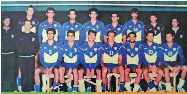
Γάνδη. Η ομάδα που προετοιμάστηκε να αγωνιστεί στα τελικά του Ευρωπαϊκού.