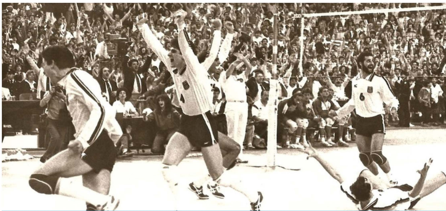
12 Απριλίου 1986. ΣΕΦ. Έξαλλοι πανηγυρισμοί στη λήξη του αγώνα με τον Καναδά, για την πρόκριση στα τελικά του Παγκοσμίου.

Α' Προπονητής της Εθνικής Ανδρών 1985-1988