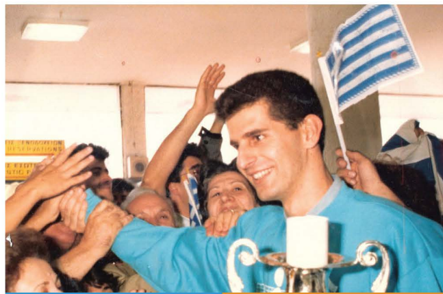
5 Οκτωβρίου 1987, Αεροδρόμιο. Οι φίλαθλοι αγαλιάζουν τον Καζάζη, στην ενθουσιώδη υποδοχή της Εθνικής.