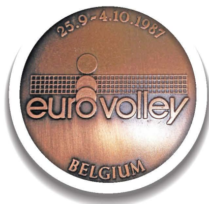
ΓΑΝΔΗ 1987. Το χάλκινο μετάλλιο.